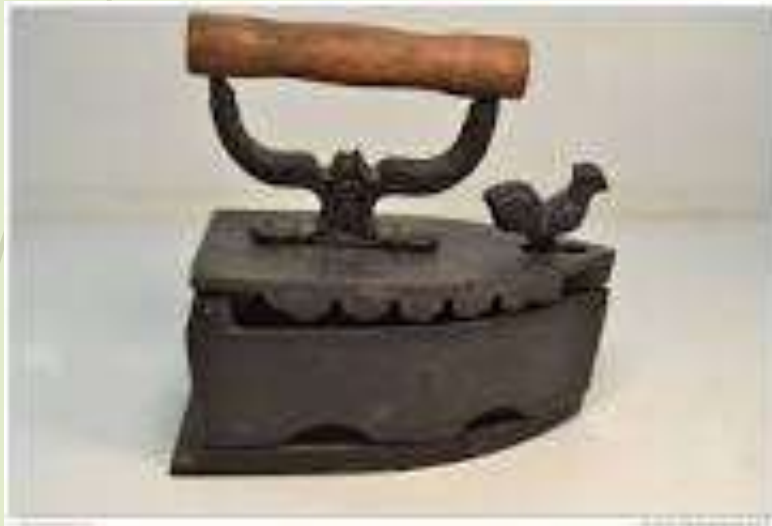
Un vieux fer à repasser