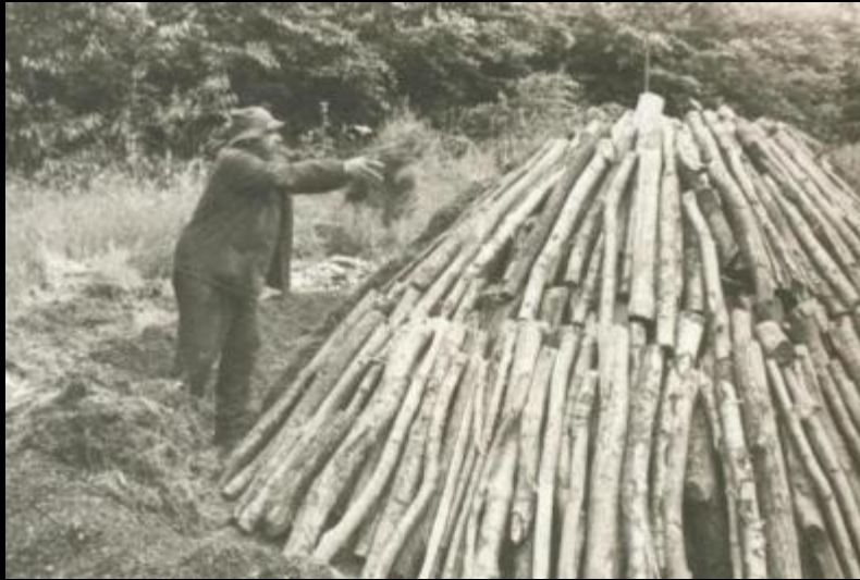
Grand livre de la forêt wallonne